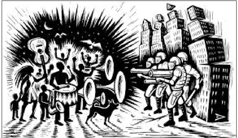
Violencia Policial, Clifford Harper.

Desde Red Roja nos sumamos a la exigencia de inmediata libertad para los dos titiriteros encarcelados tras representar una obra satírica en Madrid. Mucho nos tenemos que preocupar cuando el Estado cruza con tanta impunidad una línea tan grave como decretar prisión inmediata para unos artistas por el mero hecho de que una de las marionetas mostrara una pequeña pancarta provocativa al final de la función, que además se sacó torticeramente fuera de contexto.