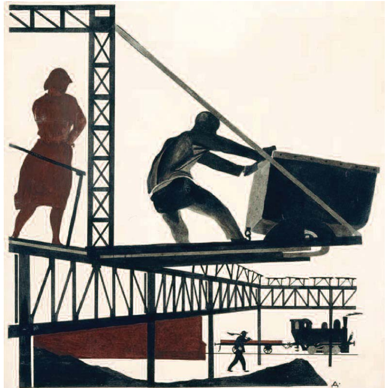
Donbass, Alexander Deineka, 1925.

Así pues, pasamos a comentar este "Plan B" siguiendo el método que ya hemos usado en otros análisis, y que no se limita a prestar atención a la "literalidad" de lo que se dice sino que trata de entender su inserción histórica real (en qué se traduce realmente en la práctica y qué papel juega o está llamado a jugar en la lucha de clases) para, finalmente, visualizar a qué responde organizativamente tanto revuelo mediático.